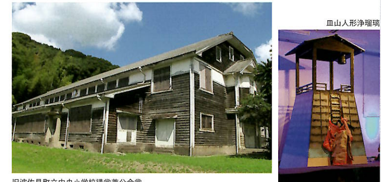
旧波佐見町立中央小学校講堂兼公会堂