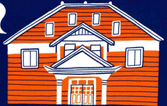
旧波佐見町立中央小学校 講堂兼公会堂