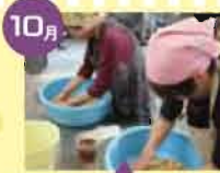
無添加味噌作り体験