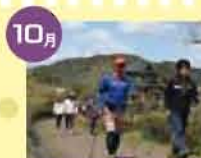
ウォーキング体験