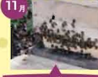
ミツバチの巣箱づくり